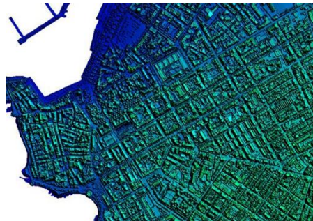
Modello Digitale della Superficie