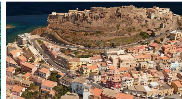
Modello Urbano 3D